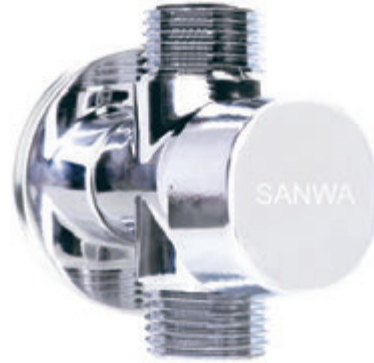
Dimension มิติ (mm.)