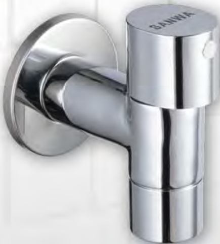
ก๊อกน้ำติดผนังเซรามิค