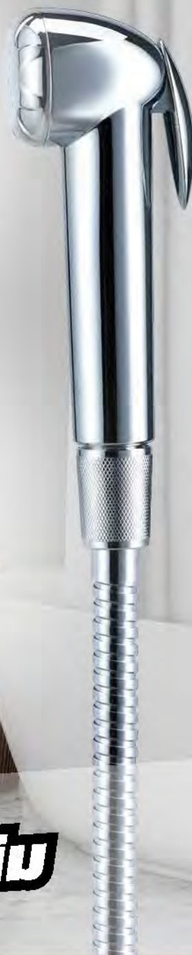
สายฉีดชำระ: