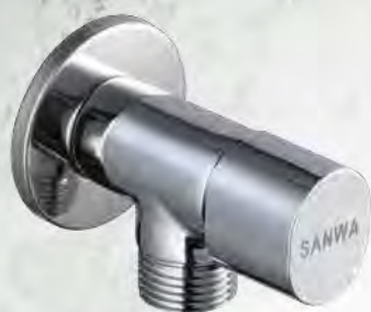
วาล์วเปิด-ปิดน้ำเซรามิค 1 ทาง