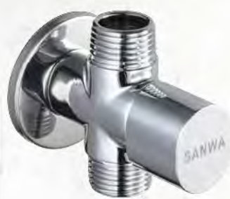
วาล์วเปิด-ปิดน้ำเซรามิค 2 ทาง