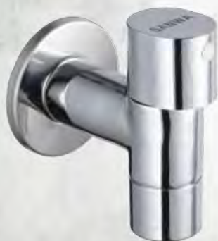
ก๊อกน้ำติดผนังเซรามิค