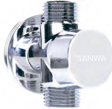
Dimension มิติ (mm.)