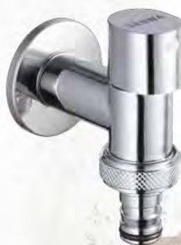
ก๊อกน้ำติดผนังเซรามิค แบบสวมสายยาง