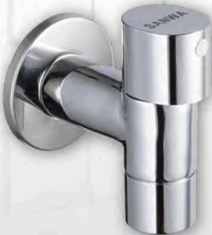
ก๊อกน้ำติดผนังเซรามิค