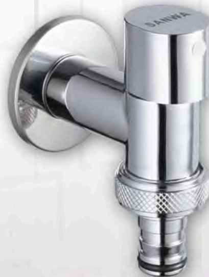
ก๊อกน้ำติดผนังเซรามิคแบบสวมสายยาง