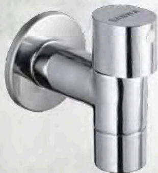
ก๊อกน้ำฉีดพ่นเซรามิก