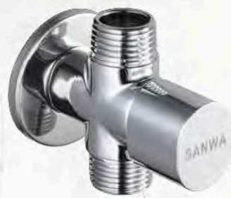
วาล์วเปิด-ปิดน้ำเซรามิก 2 ทาง