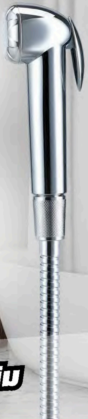
สายฉีดชำระ: