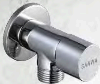
วาล์วเปิด-ปิดน้ำเซรามิก 1 ทาง