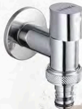
ก๊อมน้ำฉีดผนังเซรามิก แบบสวมสายยาง